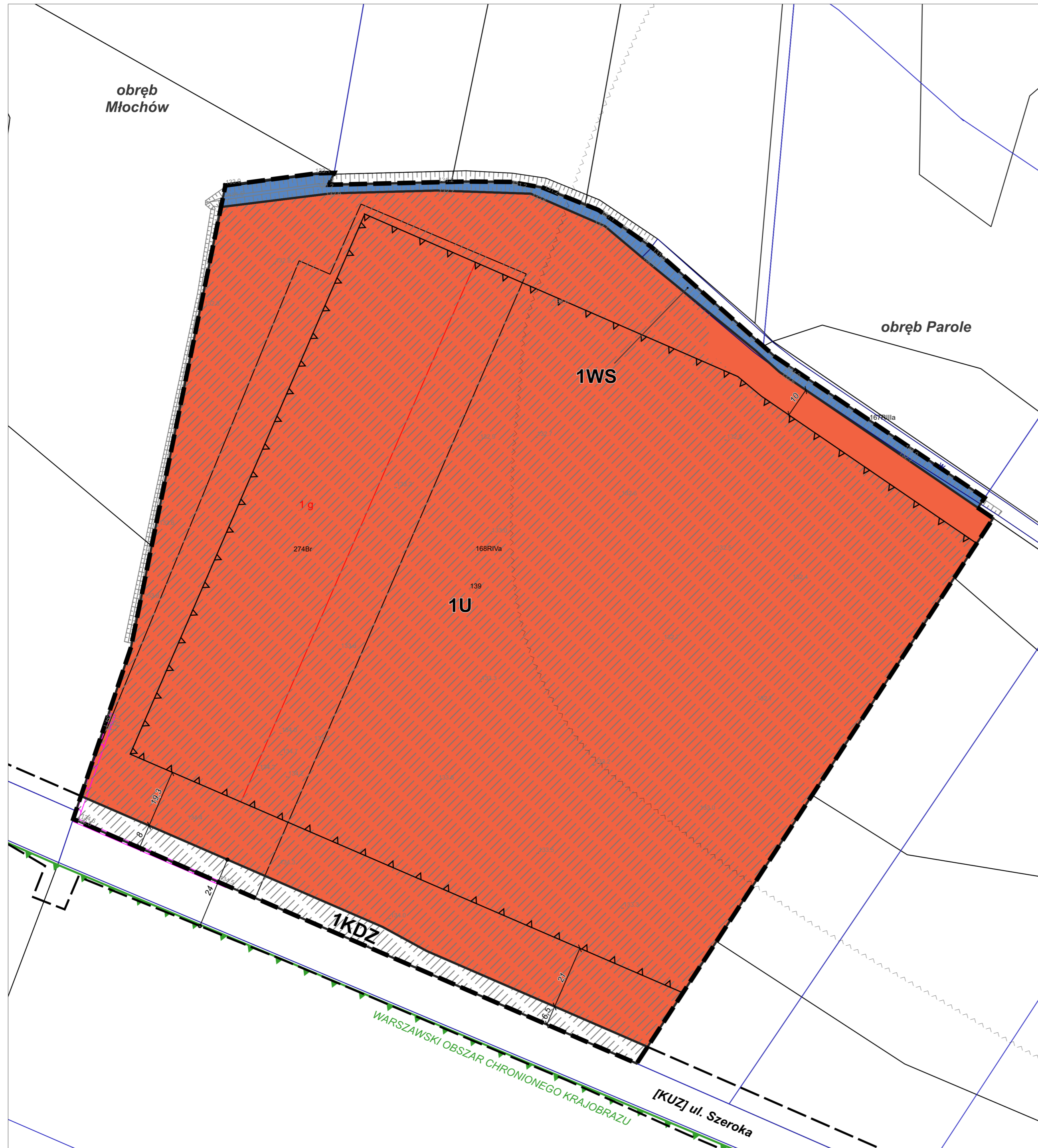
WYRYS ZE STUDIUM UWARUNKOWAŃ I KIERUNKÓW ZAGOSPODAROWANIA PRZESTRZENNEGO GMINY NADARZYN (Uchwała Nr XLII/420/14 Rady Gminy Nadarzyn z dnia 26 marca 2014 r. ze zm.) skala 1:10 000