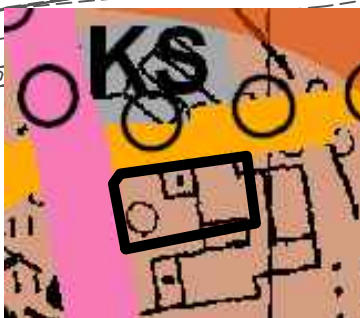
granica obszaru objętego planem miejscowym

WYRYS ZE STUDIUM UWARUNKOWAŃ I KIERUNKÓW ZAGOSPODAROWANIA PRZESTRZENNEGO GMINY NADARZYN