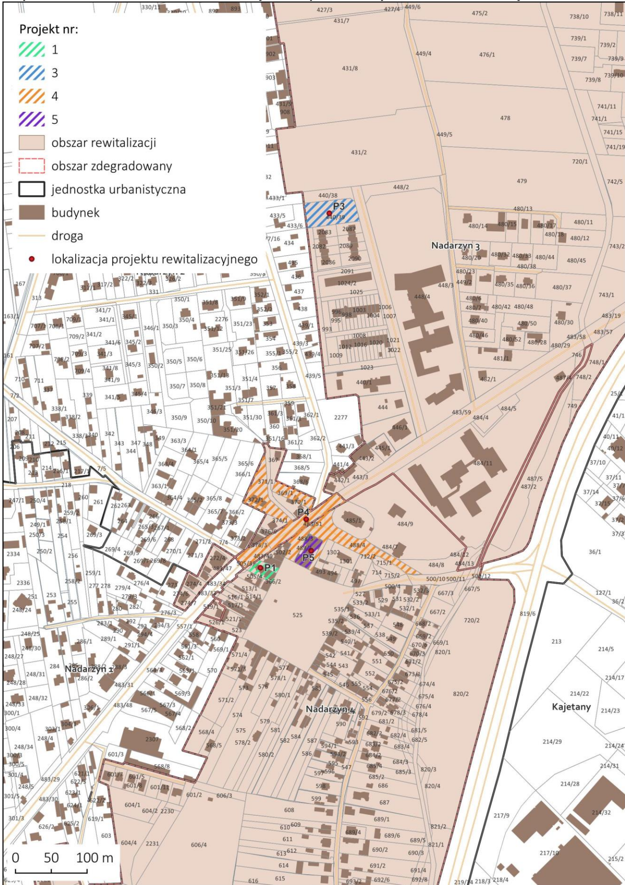
Mapa 2. Podstawowe kierunki zmian funkcjonalno-przestrzennych obszaru rewitalizacji