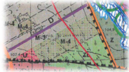
Wrys z studium Gminy Nadarzyn

w sprawie wyrażenia opinii dotyczącej pozbawienia charakteru ochronnego lasu niestanowiącego własności Skarbu Państwa na części działek ewid. nr 602/1 i 603/3 położonych we wsi Strzeniówka w gm. Nadarzyn