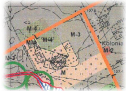
Wrys z studium Gminy Nadarzyn

w sprawie wyrażenia opinii dotyczącej pozbawienia charakteru ochronnego lasu niestanowiącego własności Skarbu Państwa na działce ew. nr 509/1 położonej we wsi Strzeniówka w gm. Nadarzyn